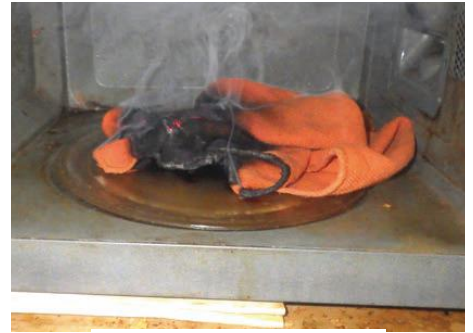
燃えた布巾の様子

高齢者が調理器具や暖房器具を、本来の用途以外に使用した火災は毎年発生しています。家族は高齢者の火の取り扱いに注意し、普段から行動を把握することが大切です。