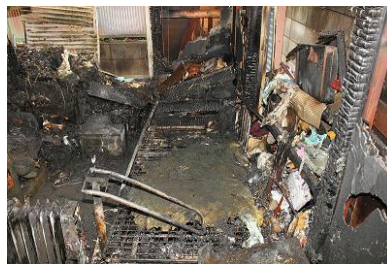
出火した部屋の様子

出火し、更に二人とも歩行が不自由だったことから避難できずに亡くなる結果となりました。コードの上に物を置いたり、踏みつけられる場所に配置したりしてコードの被覆が傷つき絶縁が保てなくなると、出火する危険性があります。点検や清掃など適正な維持管理を心掛けてください。