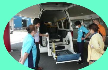
効率の良い送迎で時間短縮を目指します。