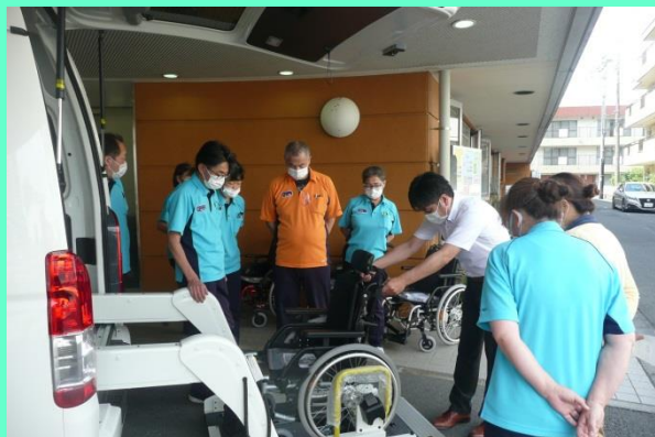
操作方法と乗り心地も体験！

新しい福祉車両（ハイエース）が納車され、活躍しています。 車椅子4台が乗れ、車椅子乗降介助を実践しました。 これからも安全な心地よい運転を心がけ、皆様に快適な送迎サービスを提供してまいります。