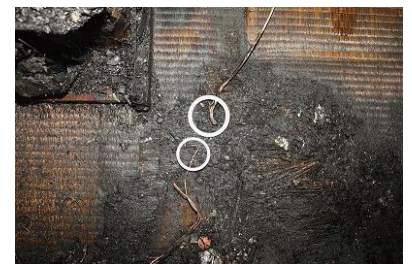
コードの短絡痕の様子

この事例のように「まさか自分のところが…」ということにならないよう、ご本人そしてご家族の方も普段から十分ご注意ください。