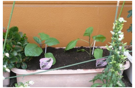
ゴーヤのグリーンカーテン成長中