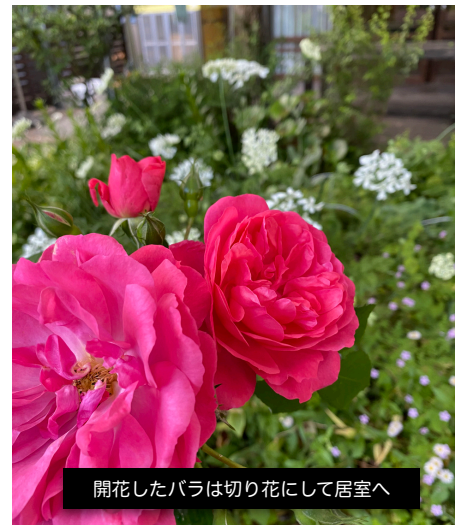
開花したバラは切り花にして居室へ