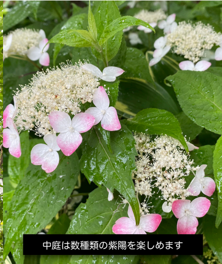
中庭は数種類の紫陽を楽しめます