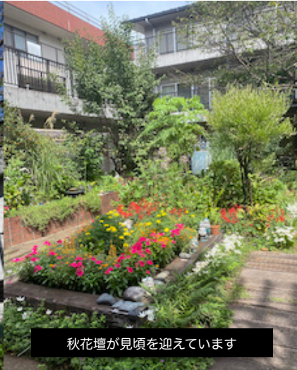
秋花壇が見頃を迎えています