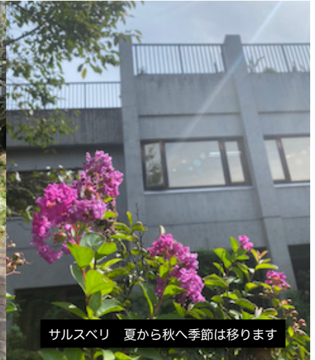
サルスベリ 夏から秋へ季節は移ります