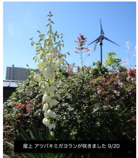
屋上 アツバキミガヨランが咲きました 9/20

心地の良い季節。みなさんよくご存知の花が多く咲いています。今年の秋、思い出の秋、秋の気配と会話をお楽しみください。中庭でお待ちしております。