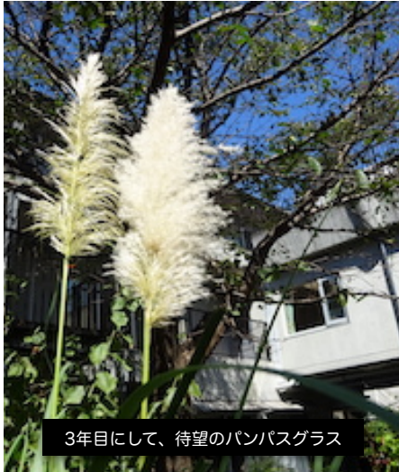
3年目にして、待望のパンパスグラス