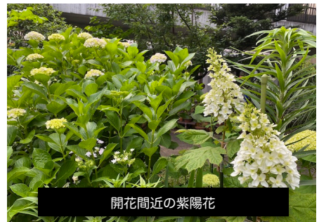
開花間近の紫陽花