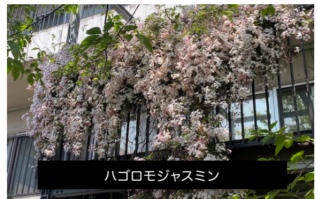
ハゴロモジャズミン