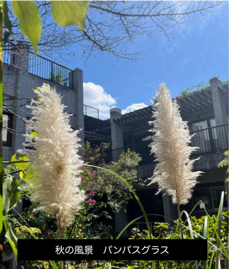
秋の風景 パンパスグラス