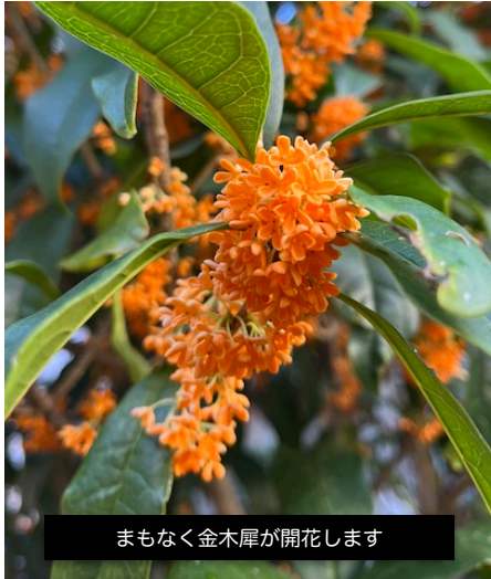
まもなく金木犀が開花します