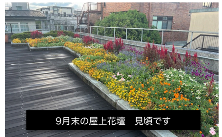
9月末の屋上花壇 見頃です

さて、10月を迎え中庭には金木犀の甘い香りが流れ始めます。金木犀に含まれる「リナロール」という成分にはリラックス効果があるそうです。また香りや記憶には深いつながりがあるそうです。どうぞ中庭で心と身体を動かし、季節の便りをお楽しみください。