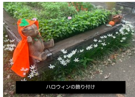
ハロウィンの飾り付け

★中庭ボランティア隊は「に和・に笑・に輪・にわづくり」を合言葉に地域の方々の参加により、四季折々の植物による福祉施設の住環境づくりに取り組んでいます 金曜日午前中に一緒に活動して下さるお仲間を募集しております