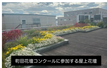
町田花壇コンクールに参加する屋上花壇

さて、朝夕の気温も下がり、作業するにも心地よい陽気となりました。彼岸花が咲き、季節の移ろいを感じさせてくれます。町田花壇コンクールに参加する花壇も見頃を迎えています。百日草、千日紅、マリーゴールド、ケイトウ、サルビア等。秋らしい落ち着いた彩りを見せてくれています。タマスダレ、ススキ、秋桜も咲き出し、間もなく金木犀の香りが漂い始めます。楓や銀杏、トウダンツツジ、秋の深まりとともに紅葉を楽しむ木々も配置しています。秋の香りや空気を感じて、心と身体を動かし、季節の便りをお楽しみください。