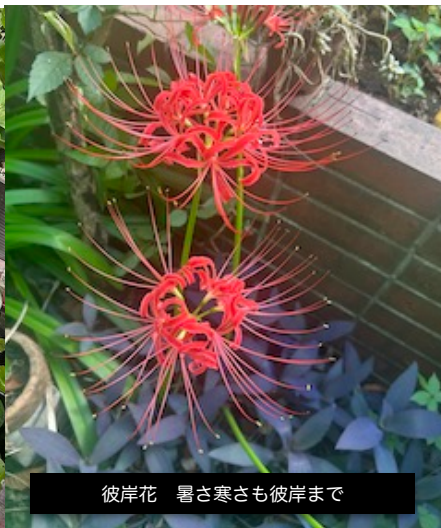
彼岸花 暑さ寒さも彼岸まで