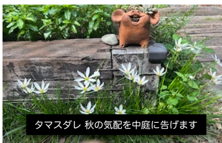
タマスダレ 秋の気配を中庭に告げます